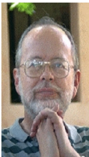
Lluís Maria Xirinacs (1932-2007).